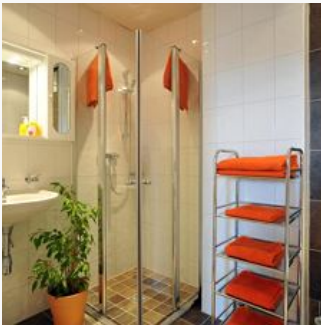
2-4 Personen · 1 Slaapkamer