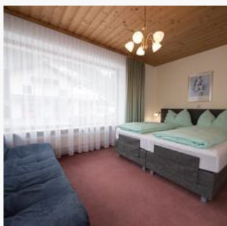
4-5 Personen · 1 Slaapkamer