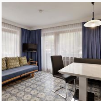
2-4 Personen · 1 Slaapkamer