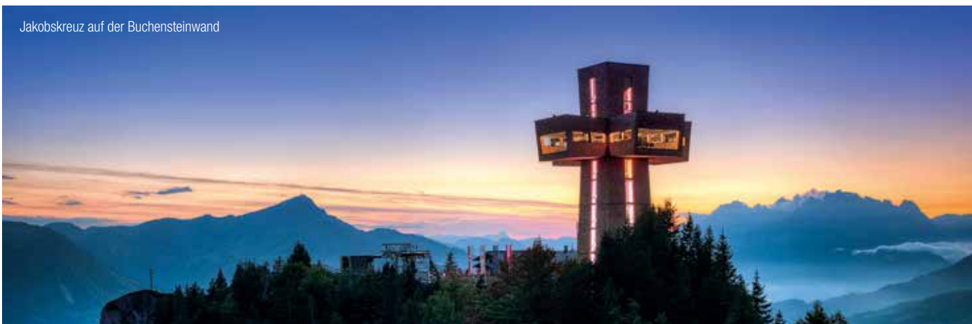
Jakobskreuz auf der Buchensteinwand

Die 1997 neu renovierte Ortskirche, ist dem heiligen Apostel Jakobus dem Älteren geweiht (erste urkundliche Erwähnung im Jahre 1308).