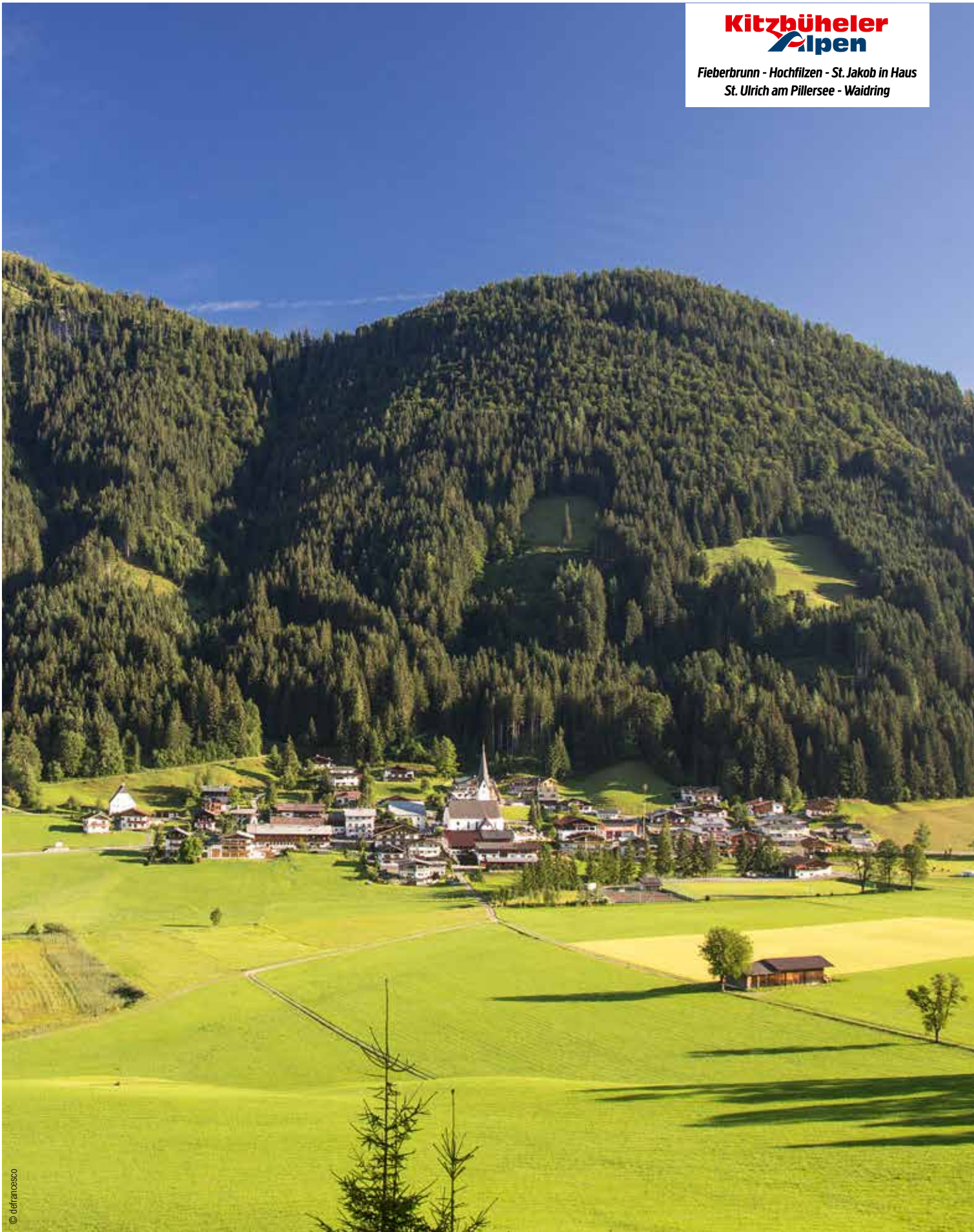
© G. H. F. H. S. 11/2018