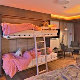
1-4 Personen • 1 Schlafzimmer

Mehrbettzimmer mit Doppelbett + Etagenbett, bis zu 6 Personen möglich, WC, Dusche/Bad, SAT-TV und Balkon.