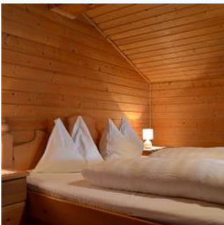
1-4 Personen · 1 Schlafzimmer

Das gemütliche Appartement bietet Platz für 4 Personen. Es besteht aus einem Schlafzimmer und einer Wohnküche. Ebenfalls ist die Ferienwohnung mit Dusche/WC und einem Balkon ausgestattet.