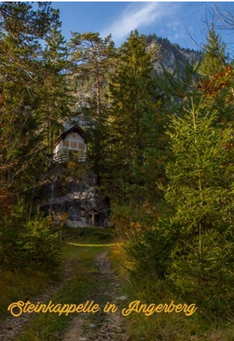
Steinkappelle in Angerberg

Ferienwohnung / Appartement in Angerberg