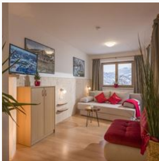
2-5 Personen · 1 Schlafzimmer

50m 2 großen, Nichtraucher-Appartements. Küche komplett ausgestattet. Schlafzimmer, Du/Wc, Kabel-TV. Wohnschlafraum mit 10m 2 großer südseitiger Terrasse.