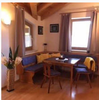
2-4 Personen · 1 Schlafzimmer

50m 2 großen, Nichtraucher-Appartements. Küche komplett ausgestattet. Schlafzimmer, Du/Wc, Kabel-TV. Wohnschlafraum mit 10m 2 großer südseitiger Terrasse.